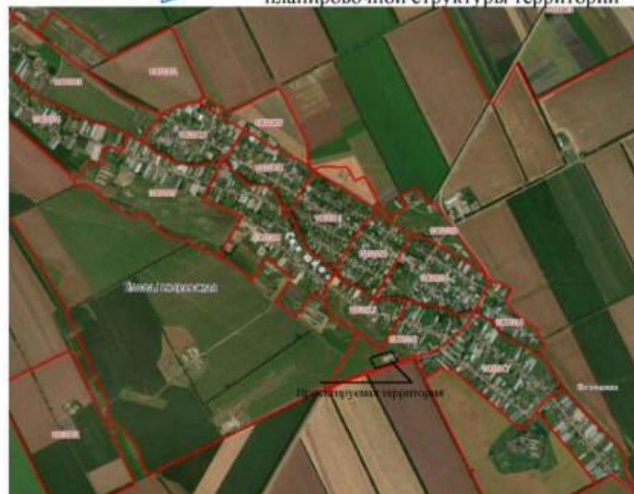
Схема расположения элемента планировочной структуры территории